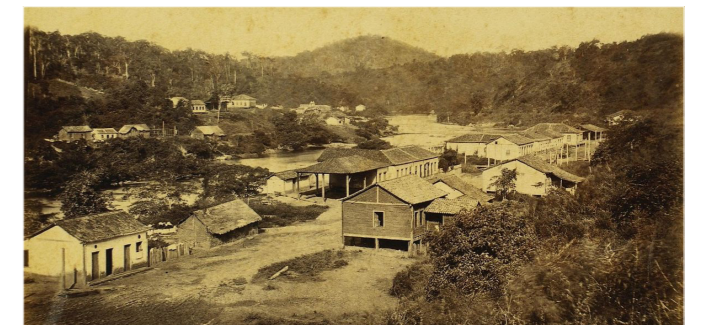
Siidlung Luxemburgo a Brasilien