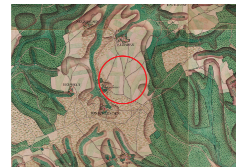
Cartographie: Ferraris, Joseph-Johann-Franz (1726-1814) - comte