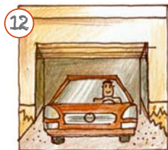
Ech fuere mam Auto fort.