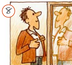
Ech kucke mech am Spigel.