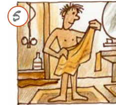
Ech dréchné mech of.