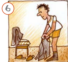
Ech doe mech un.