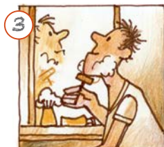
Ech raséiere mech.