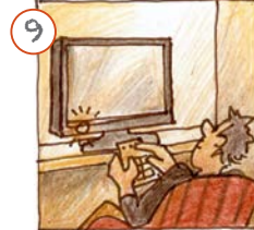
Ech maachen d'Télee un.