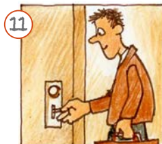
Ech späert d'Dier zou.