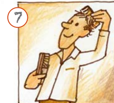
Ech kämme mech.