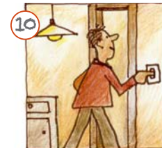
Ech maachen d'Luucht aus.