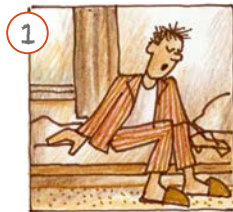
Ech stinn op.