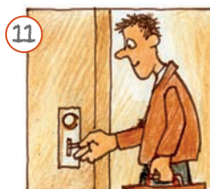
Ech späeren d'Dier zou.