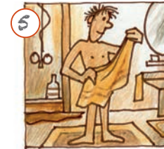
Ech dréchné mech of.