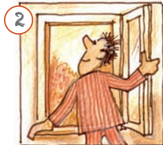
Ech maachen d'Fenster op.