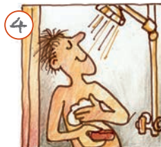
Ech dusche mech.