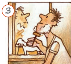
Ech raséiere mech.