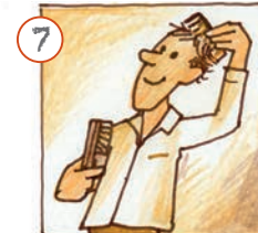
Ech kämme mech.