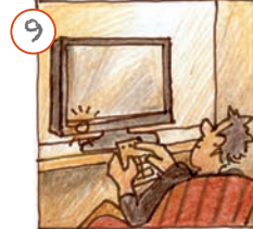
Ech maachen d'Télee un.