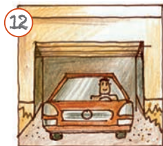
Ech fuere mam Auto fort.