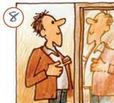
Ech kucke mech am Spigel.