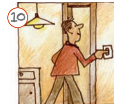
Ech maachen d'Luucht aus.