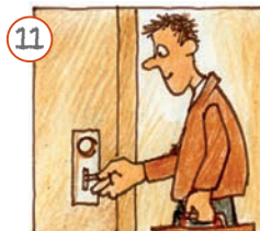
Ech späeren d'Dier zou.