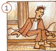
Ech stinn op.