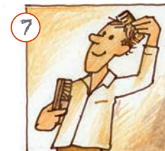
Ech kämme mech.