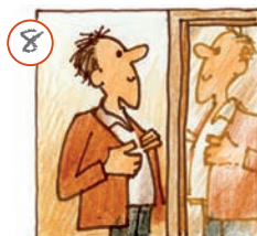
Ech kucke mech am Spigel.