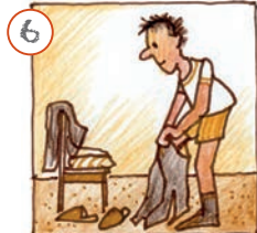
Ech doe mech un.